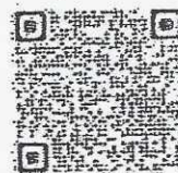
คู่มือฯ ๑ 11/2564 (ศึกษานิเทศก์)