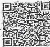
คู่มือฯ ๖ 12/2564 (ผู้บริหารการศึกษา ศษช.)