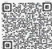
คู่มือฯ ๖ 10/2564 (ผู้บริหารสถานศึกษา)