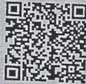
สิ่งที่ส่งมาด้วย ๑