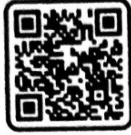
ลายขอเจ้าฟ้า

๔) มีการประยุกต์ผ้าลายพระราชทานของสมเด็จพระเจ้าลูกเธอเจ้าฟ้าสิริวัณณวรี นารีรัตนราชกัญญา ประกอบด้วย “ลายขอเจ้าฟ้า” “ลายบิดนาริรัตน” “ลายดอกกรักราชกัญญา” “ลายสิริวัณณวรี ผ้าบาติก” และ “ลายขบาปัตตานี” ลงบนผืนผ้า ให้มีความทันสมัยและผสมผสานกันอย่างกลมกลืน รายละเอียดตาม QR Code ด้านล่างนี้