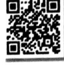
ลายสิริวัณณวรี