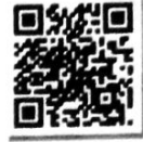
ลายขบาปัตตานี