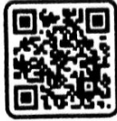
ลายบิดนาริรัตน