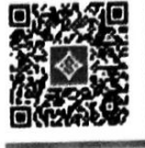
ลายดอกกรักราชกัญญา